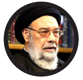
شهید رئیسی یک رئیس جمهور مردمی بود

نماینده ولی فقیه در استان و امام جمعه اصفهان با بیان اینکه شهید رئیسی تابع محض ولی فقیه بود، تصریح کرد: آیت الله رئیسی اعتقاد واقعی به نقش و جایگاه ولی فقیه و هوشمندی و درایت رهبر معظم انقلاب داشت.